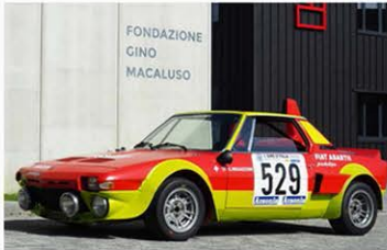
Classic car Al via la "Fondazione Gino Macaluso per l'Auto Storica"