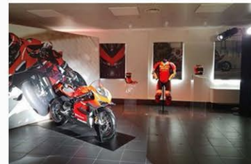
Ducati show: a Roma il debutto della Superleggera