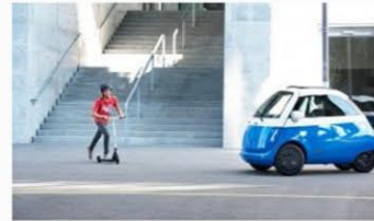
Micro Sparrow XL Il monopattino diventa "ibrido" di MAURILIO RIGO