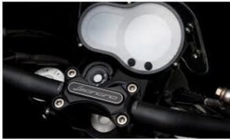
Benelli La moto su misura è servita