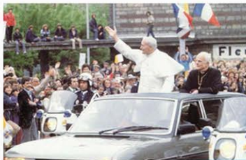
Peugeot 604 Limousine, che storia! di MAURILIO RIGO