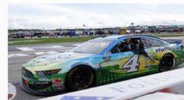
Scatto matto 55