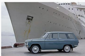
Familiari Mazda, 60 anni di servizio