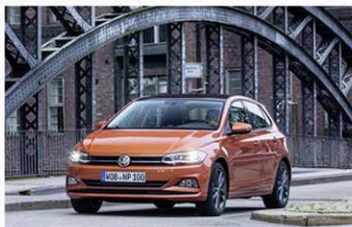
Volkswagen riparte con Care for You e Progetto Valore