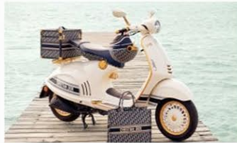
Piaggio 946 Christian Dior, la Vespa più glamour di sempre